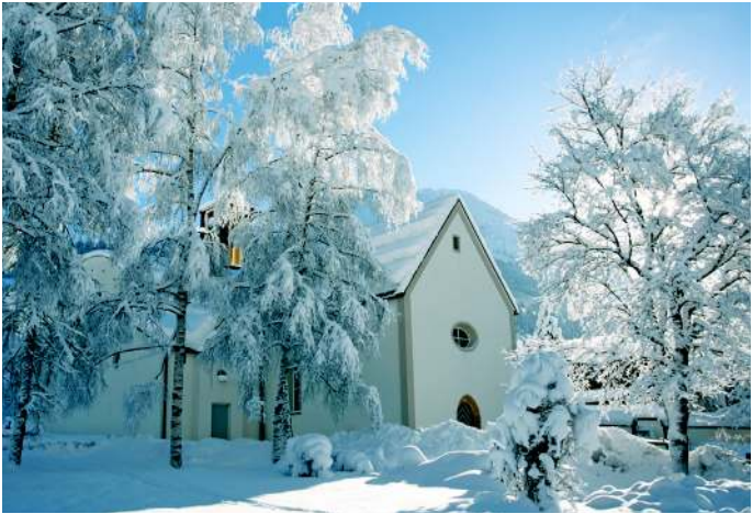
> Pfarrkirche Kleinarl