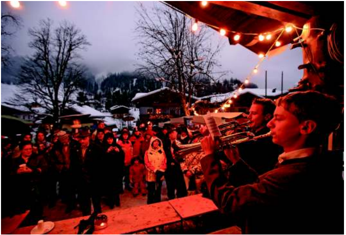
> Kleinarler Adventzauber vor dem Musikpavillon in Kleinarl