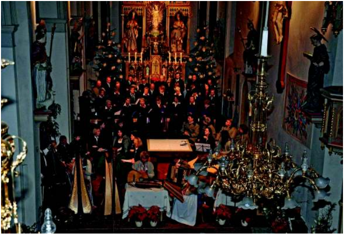
> Joseph Mohr Gedächtnissingen in der Pfarrkirche Wagrain