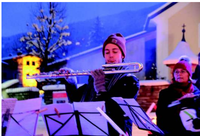
> Advent in Wagrain-Kleinarl