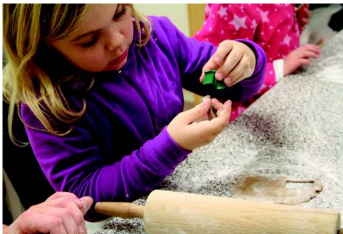
> „Stille Nacht“ Kinderbackstube