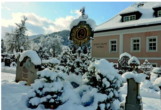
> Joseph Mohr Grab bei der Pfarrkirche Wagrain